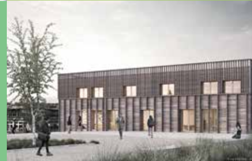
Le (Li)VE, un lieu central et polyvalent de la vie étudiante

Le programme de modernisation du campus transformera les anciens bureaux du Crous en un lieu de convivialité dédié aux étudiants : le (Li)VE. Complémentaire à la Maison des Étudiants, ce bâtiment totalement réhabilité accueillera une épicerie solidaire, une ressourcerie, un espace de convivialité, des locaux pour les associations... Afin de décloisonner les composantes UFR et de stimuler la vie