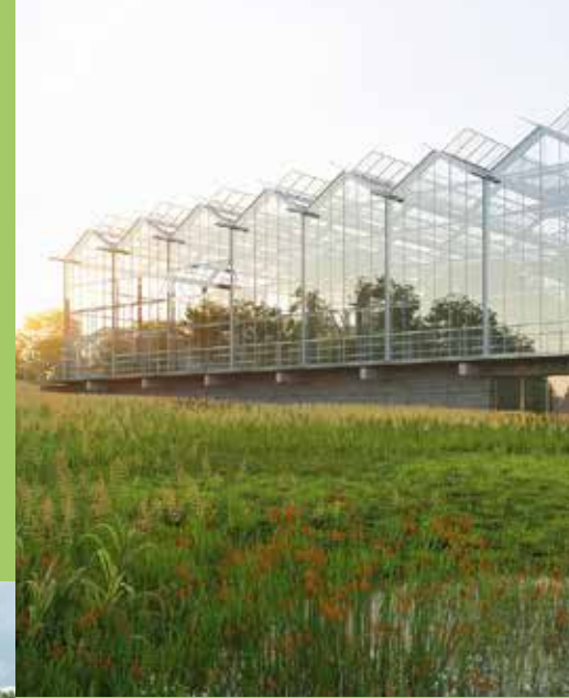
Collections botaniques d'exception et vaste parvis mettront en scène le Jardin des Sciences

Avec ses équipements ouverts à tous, le campus deviendra un lieu de rencontre et de vie digne d'un vrai quartier ! Au cœur de celui-ci, l'AREA Sport offrira un espace sportif entièrement rénové avec terrain de rugby enherbé, piste d'athlétisme quatre couloirs, tracés de parcours acrobatiques urbains adaptés... Sa gestion et son animation seront assurées par la Maison du Sport, infrastructure universitaire inédite.